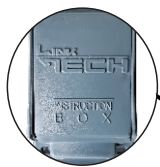
Caja Protectora de Etiquetas

Eslinga Sencilla con Absorbedor Regulable