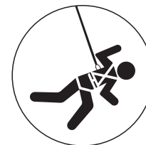
Detención de caídas

Eslinga para detención de caídas en reata con sistema de absorción de energía para disipar la fuerza de impacto sobre el usuario, reduciendo a menos de 900 lbs para caídas factor 1. Inspección Haga de la inspección una rutina antes de cada uso. Inspeccione siempre su equipo antes de cada uso para detectar daños, deterioro o mal funcionamiento. Además, se debe preparar un plan de inspección por parte de personal calificado. Se deberá archivar un registro escrito y/o electrónico de dicha inspección. Mantenimiento Lavar a mano con agua tibia y jabón neutro, secar colgado siempre a la sombra. Guarde su equipo en un lugar seco, libre de gases corrosivos y peligrosos, así como fuera del contacto directo con la luz solar. La política de seguridad de los productos LINKTECH se basa en el estado de los artículos y no en la antigüedad. Sus artículos se pueden usar hasta que se vuelvan obsoletos, se señale daño, desgaste o cualquier otra característica que pueda amenazar la seguridad durante una inspección