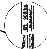
Amortiguador de impacto