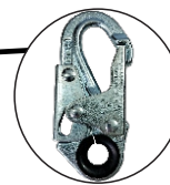
Gancho en Acero Forjado de 3/4" de Apertura