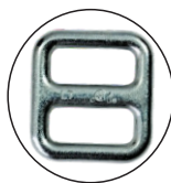
Hebilla de ajuste en Acero Acero Forjado