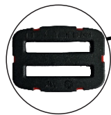
Hebilla de ajuste