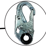
Gancho en Acero Forjado de 3/4" de Apertura