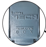
Caja Protectora de Etiquetas